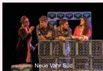
Neue Vahr Süd